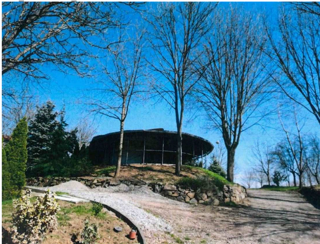
Zdroj: Znalecký posudek č. 67-13/2024